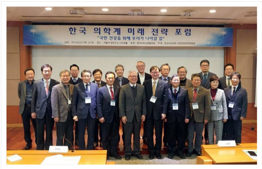
< 한국 의학회 미래 전략 포럼 >