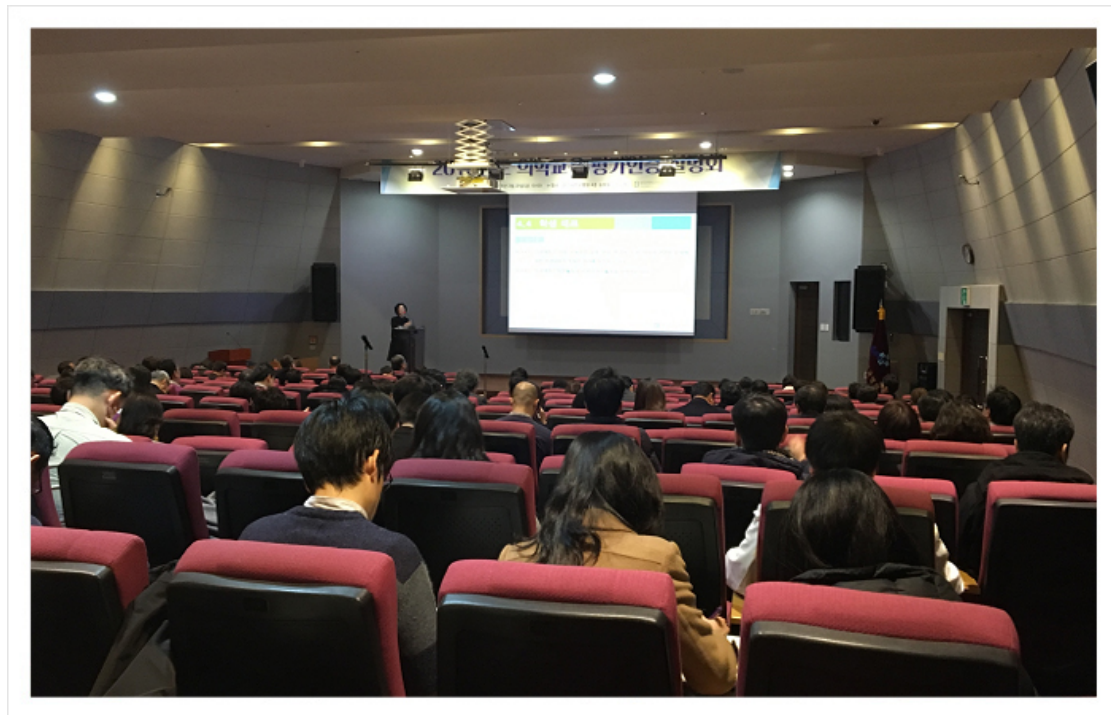
< 2018년도 의학교육 평가인증 설명회 >