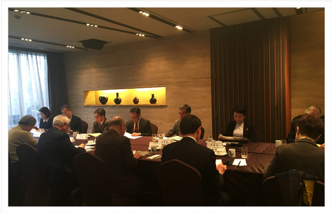
< 제21차 정기 이사회 >