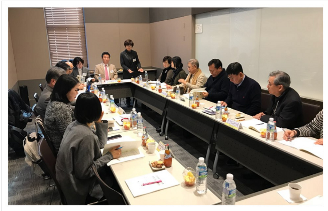
< 고등교육평가·인증인정기관협의회 회의 >