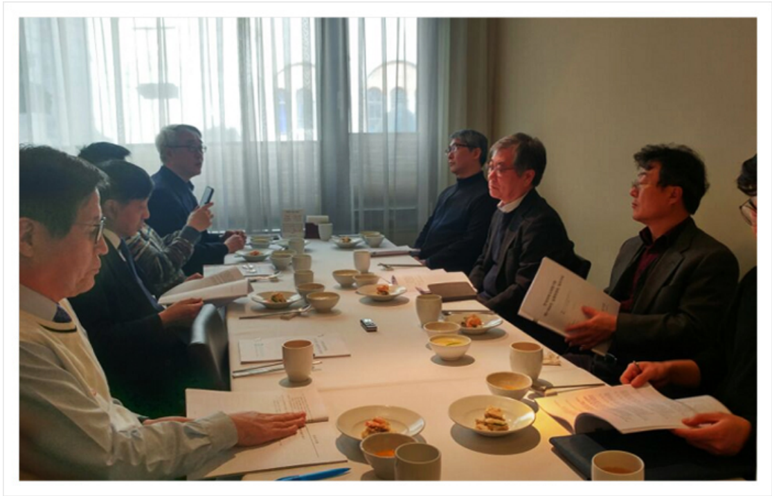
< 제5-004차 실행위원회 >