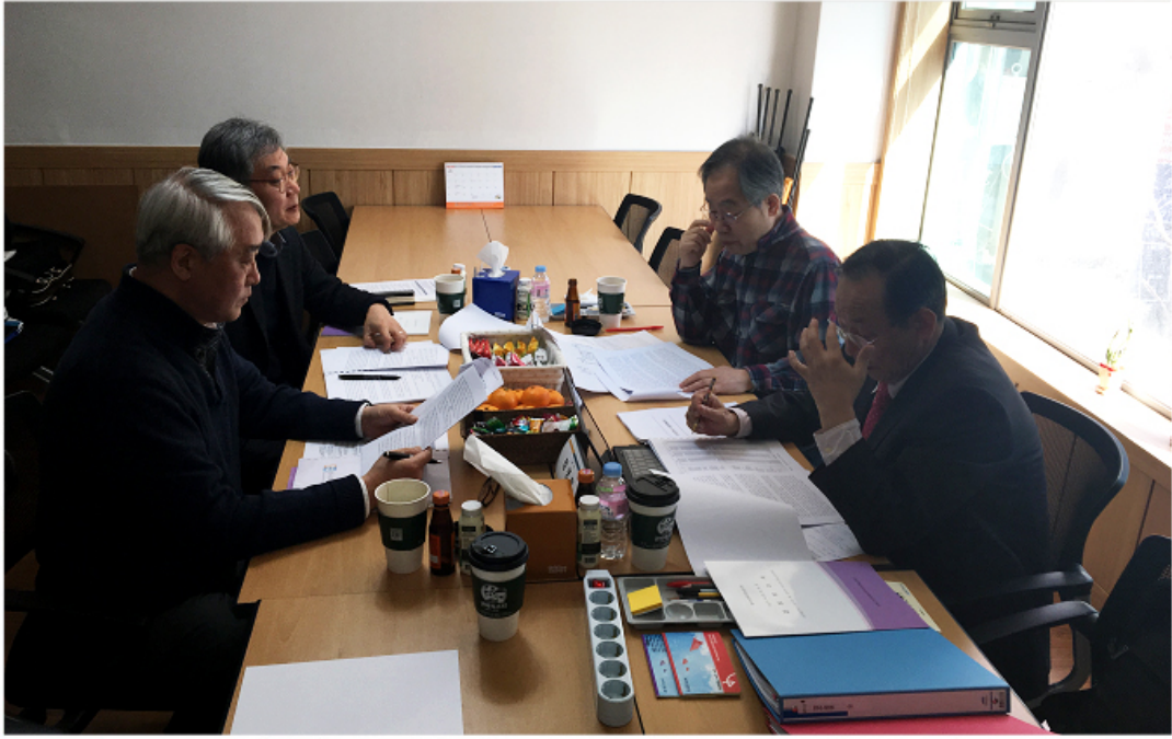
< 2017년 정기 감사 >