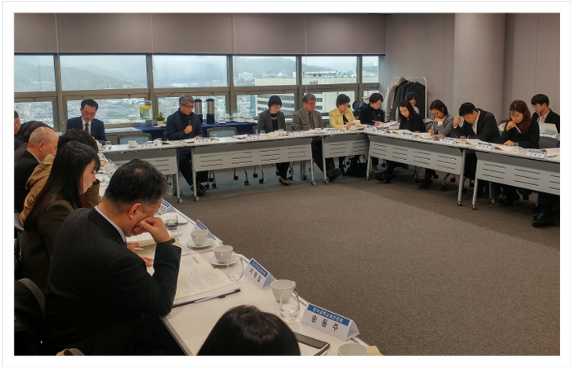
〈 인정기관 역량강화 워크숍 〉